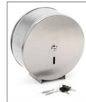
Dispenser papel higienico