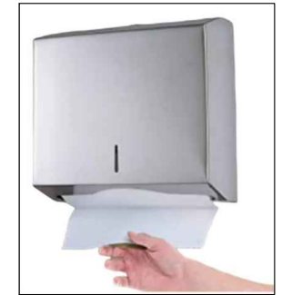
Dispenser toallas de papel