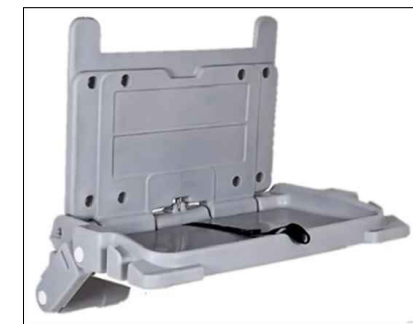
Cambiador de bebé

MPF MINISTERIO PÚBLICO FISCAL DE TUCUMÁN