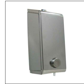
Dispenser alcohol en gel / Dispenser jabón líquido